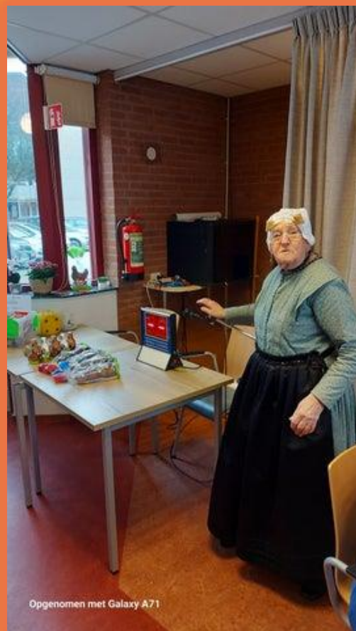
Opgenomen met Galaxy A71