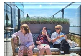
Lekker in het zonnetje