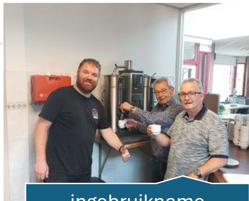
ingebruikname nieuwe koffiemachien

Ook kreeg de AOBK van WZK een nieuwe koffiemachine in beheer, de oude was al dik 25 jaar oud en aan vervanging toe.